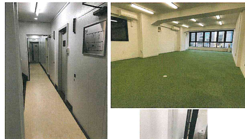
トイレ・給湯室・廊下リニューアル工事 1階ゴミ置き場完備・貸室内SECOM

個別空調切り替え・外壁カーテンウォール 電気容量増設・共用部リニューアル・屋上防水